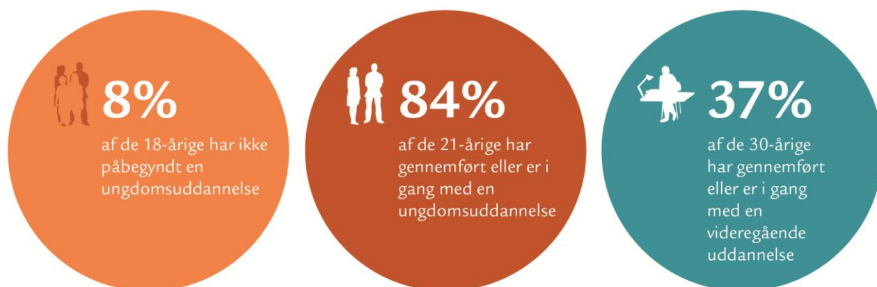
Figur 3 – Nedslag i et øjebliksbillede på uddannelsesområdet i Nordjylland

En ting er prognoser som eksempelvis Profilmodellen, der kan vise noget om, hvad vi kan forvente os et stykke ud i fremtiden. Noget andet er de faktiske og aktuelle tal for uddannelsesområdet i Nordjylland. Nordjysk Uddannelsesindblik 2015 3 viser, at vi her og nu fortsat har en række udfordringer. Det drejer sig eksempelvis om at få så mange unge som muligt i gang med en ungdomsuddannelse efter grundskolen – hvad enten det er på en erhvervsuddannelse eller en gymnasial uddannelse. Lige nu er der ca. 8 % af alle 18-årige i Nordjylland, som slet ikke har påbegyndt en ungdomsuddannelse.